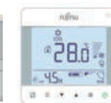
Bediening touch/LCD, 2-draads, inbouw