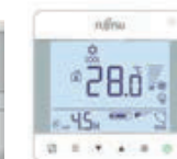
Bediening touch/LCD, 2-draads, inbouw