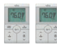
Bediening 2-draads met en zonder functietoets