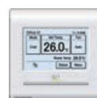
Bediening Easy touch/ LCD, 2-draads