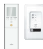
Set IR bediening