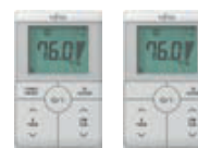
Bediening 2-draads met en zonder functietoets