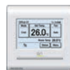
Optioneel bediening Easy touch / LCD 2 draads