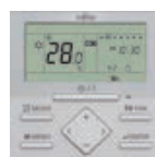
Standaard bediening LCD 2 draads