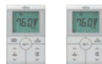
Eenvoudige bediening 2-draads met en zonder functietoets