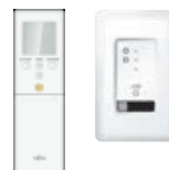
Optionele set IR bediening